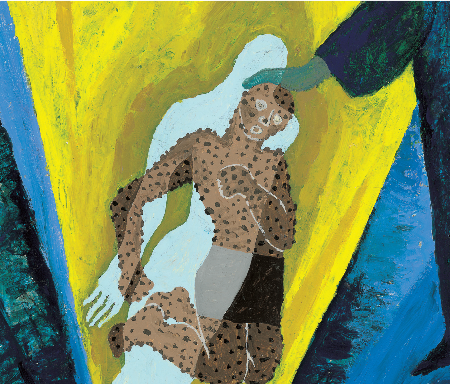
그림 : 정미연 소화테레사

2021년 교구장 사목교서 - “너희는 나를 기억하여 이를 행하여라.”(루카 22,19)